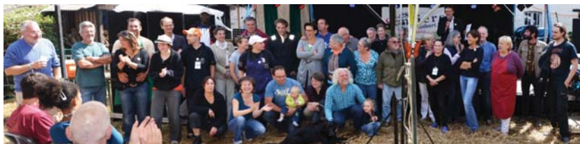
Le Comité des villageois

Nous avons besoin de vous pour pérenniser le festival et réaliser ces deux projets qui prendront vie grâce à VOTRE participation !